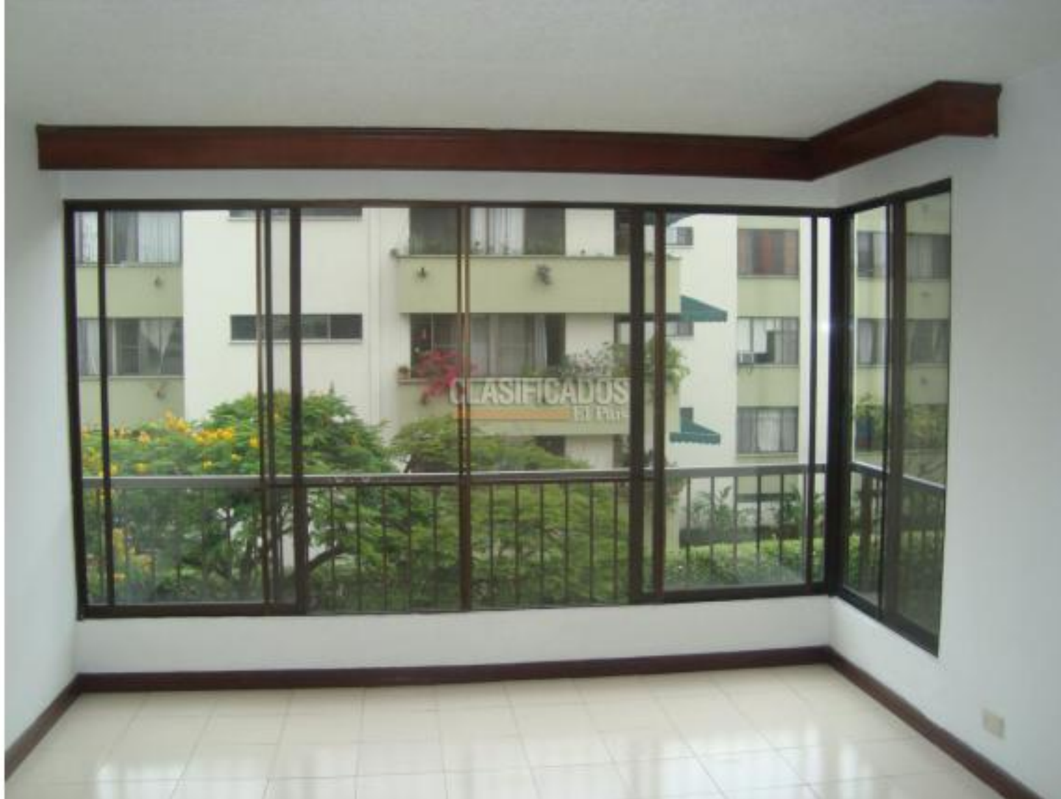
Apartamentos, Alquiler, Multicentro