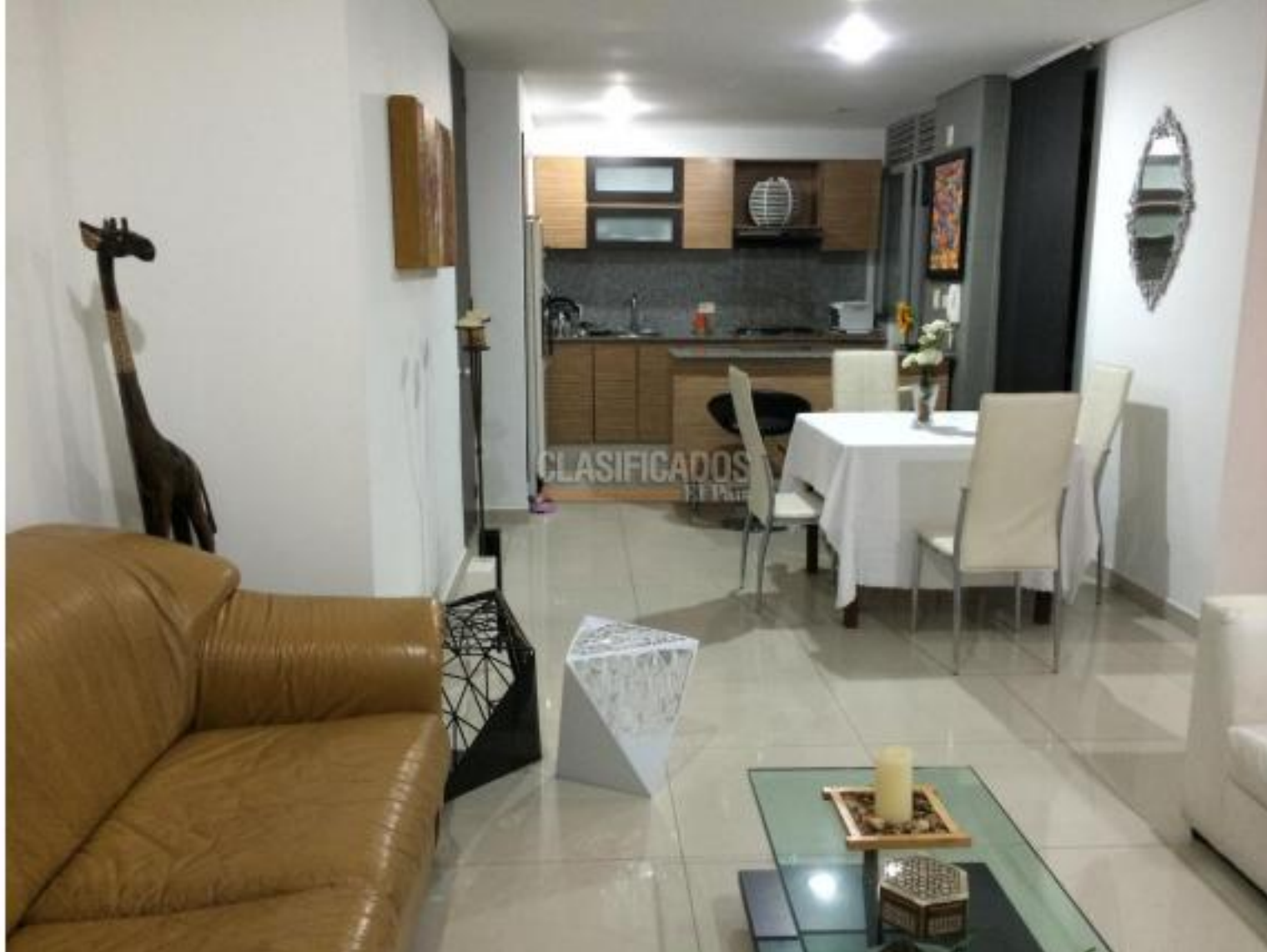
Apartamentos , Venta , Valle del Lili