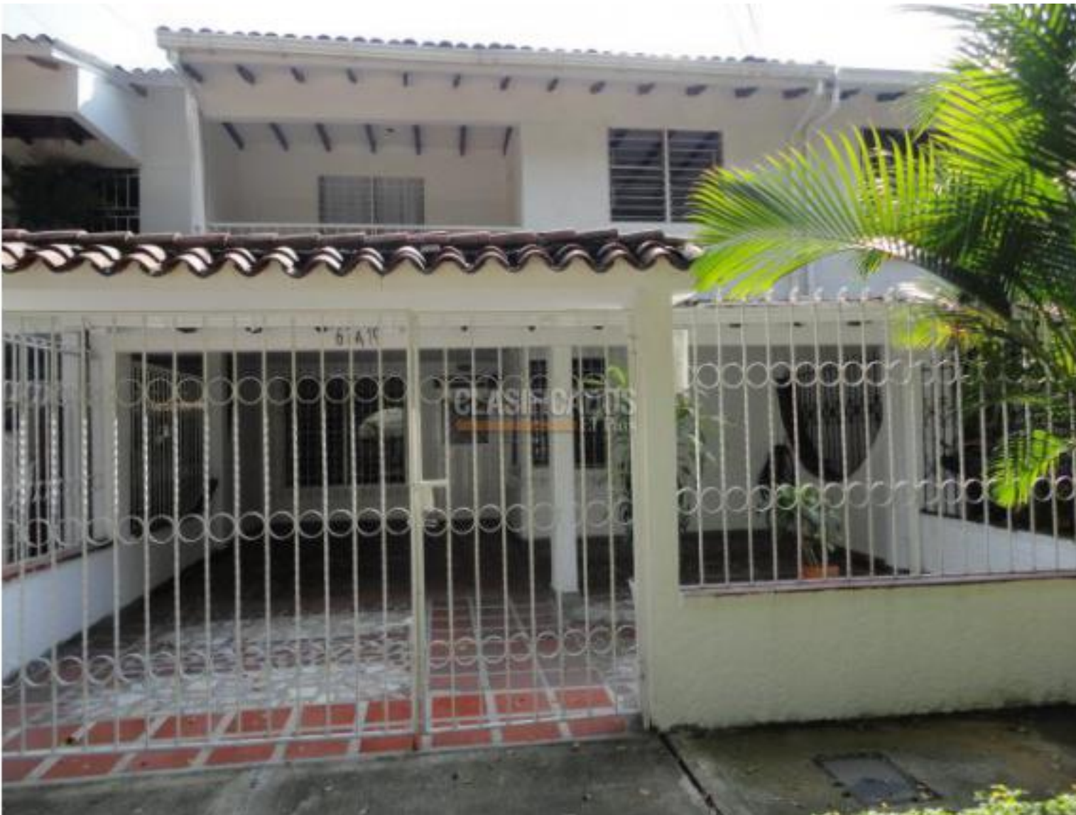
Casas , Venta , Cataya