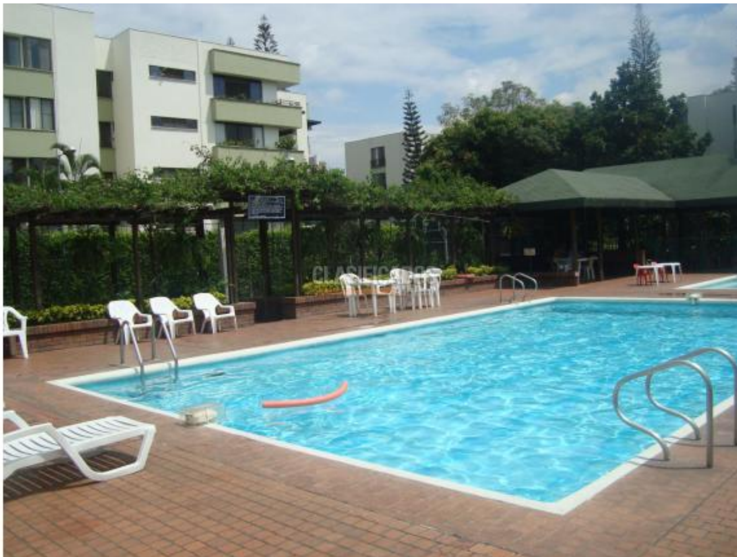
Apartamentos, Alquiler, Multicentro