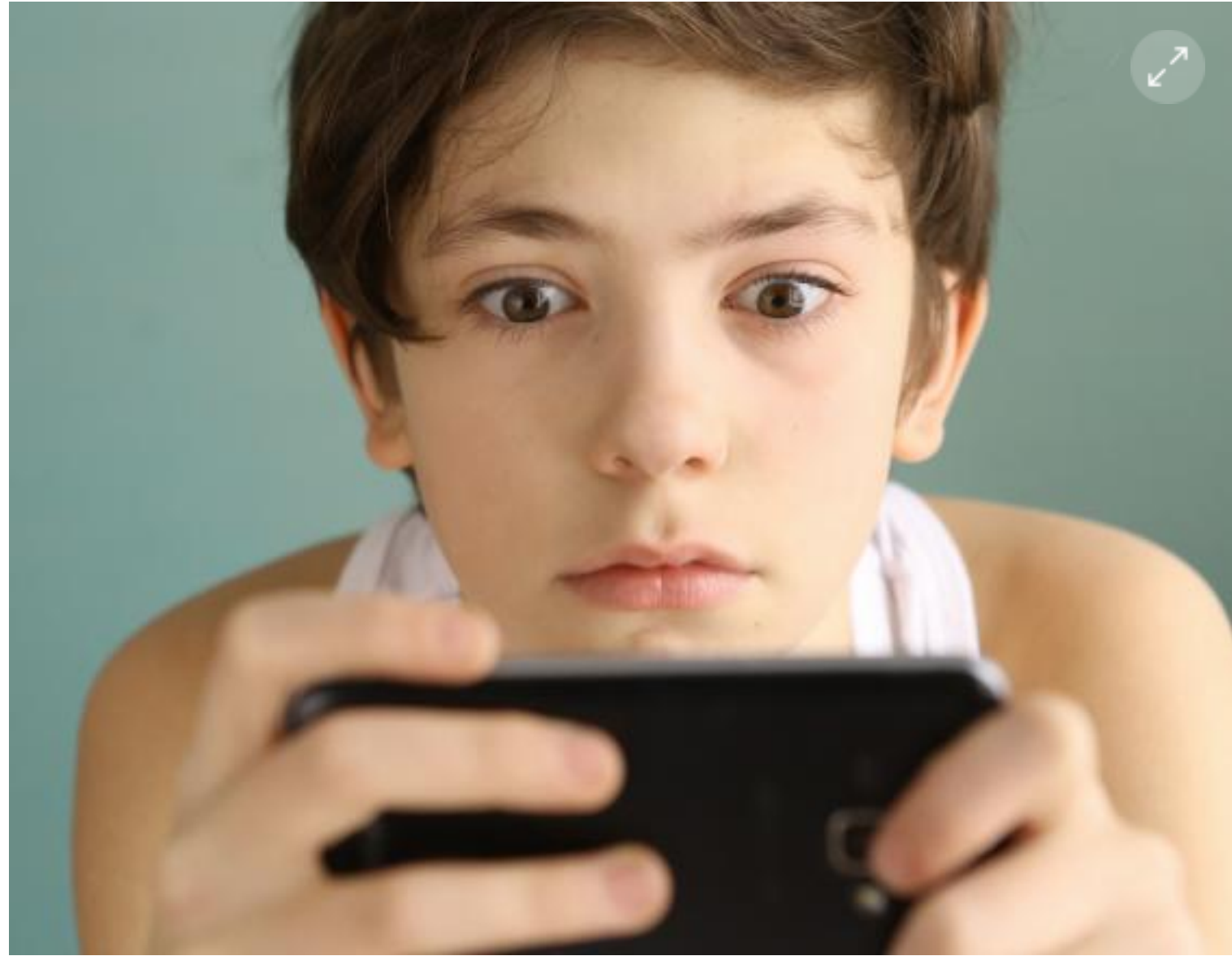
Todo adulto puede evitar que un menor de edad tome una determinación nociva para su vida. Los expertos le dicen cómo proteger a niños y adolescentes.

Lea aquí: Icbf convoca a movilizarse en rechazo a nuevos abusos contra menores de edad.