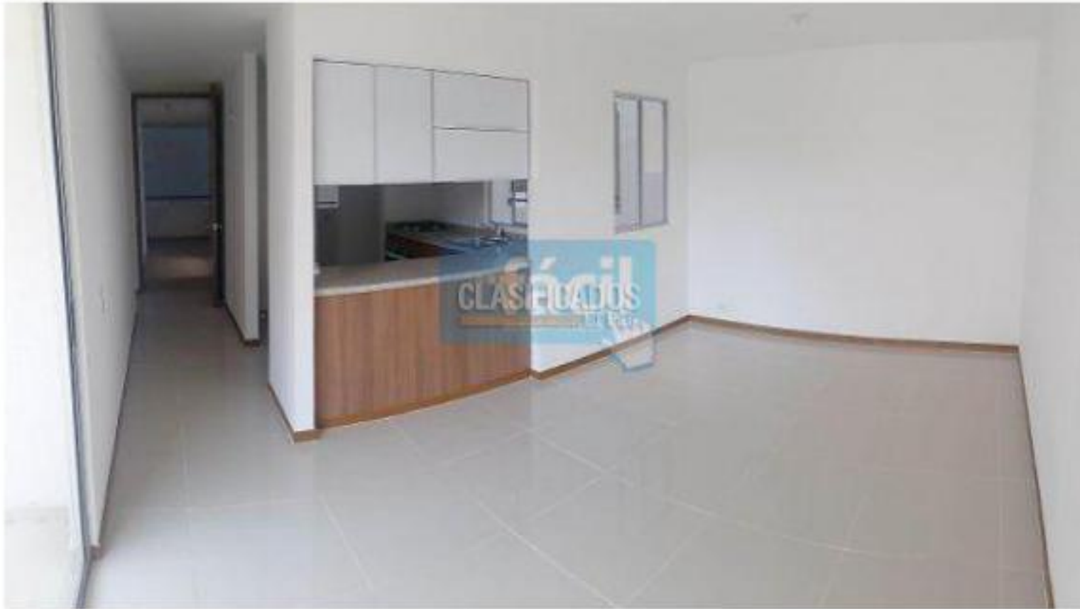
Apartamentos , Venta , Ciudad Bochalema