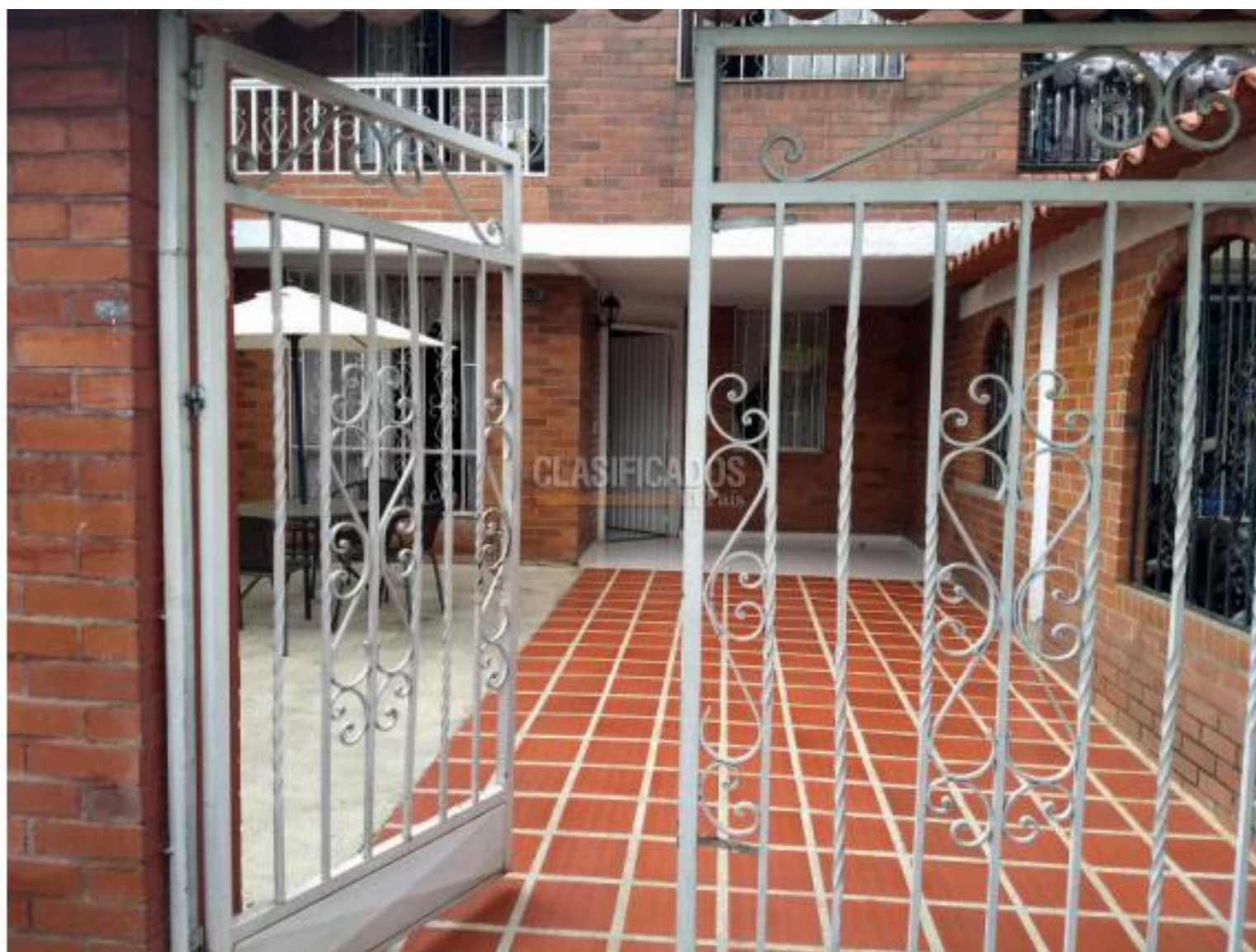
Casas , Venta , Caney