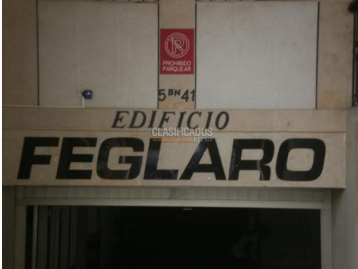
Oficinas y Consultorios , Alquiler , San Vicente