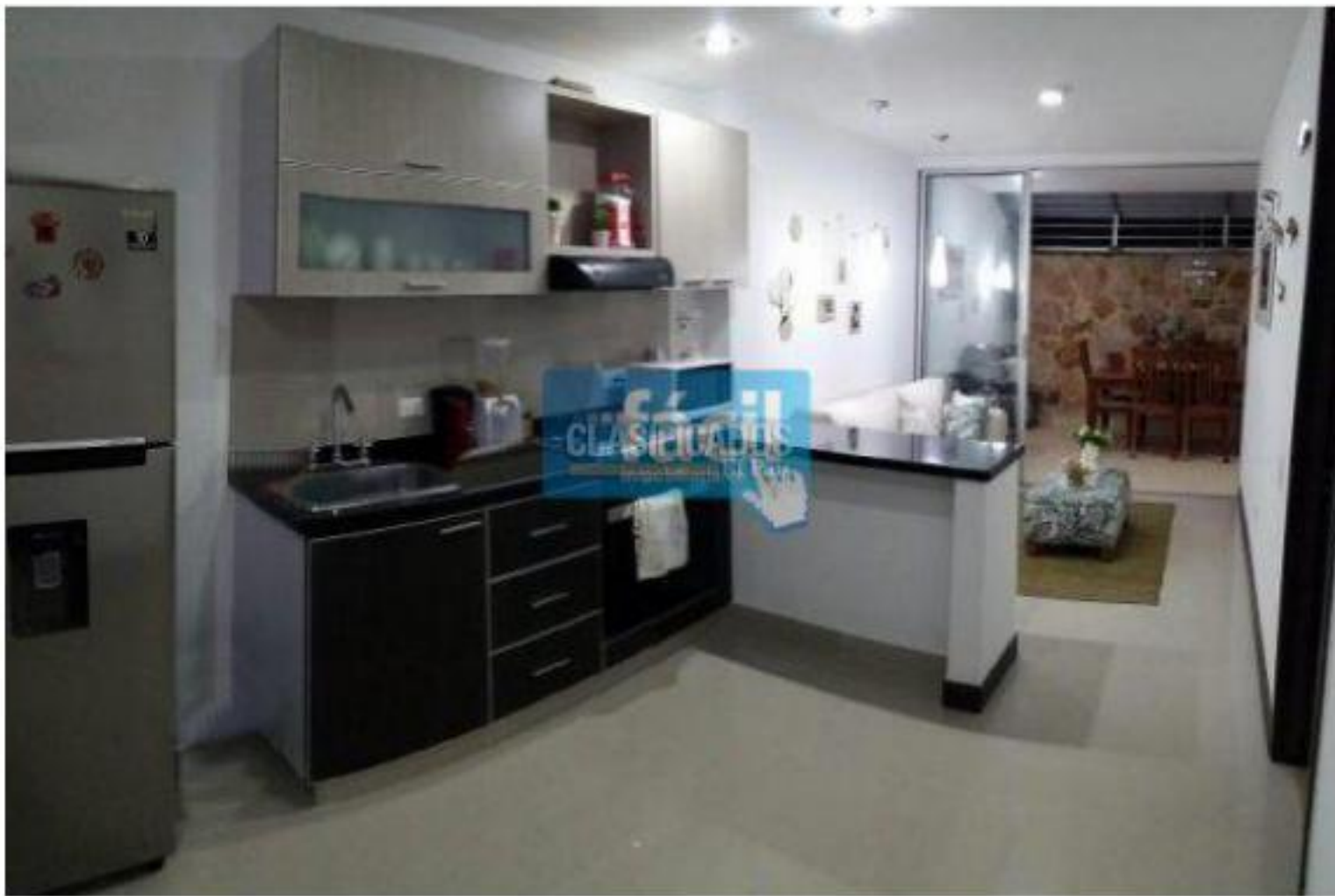
Apartamentos , Venta , Cristales