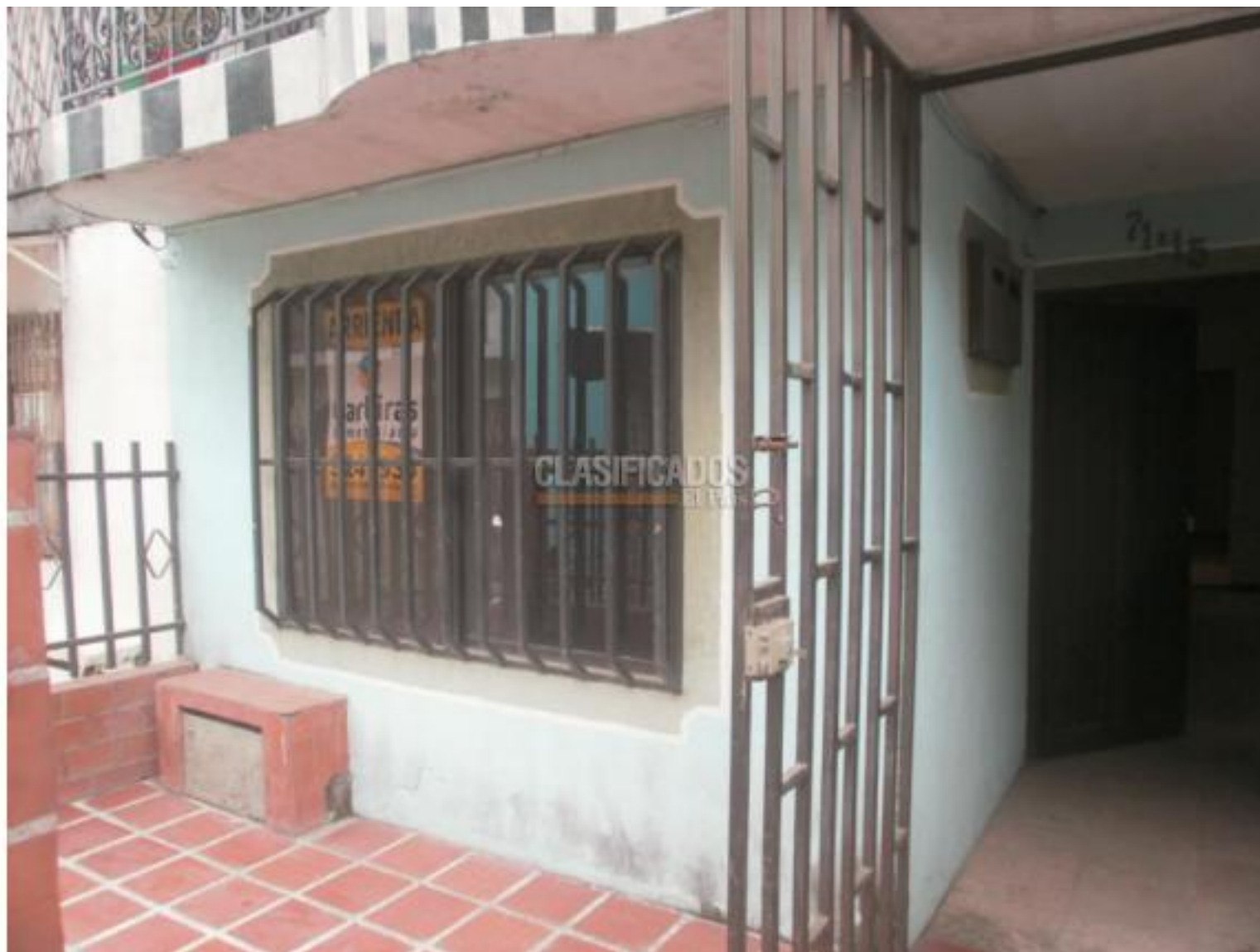
Casas , Alquiler , Los Guadales