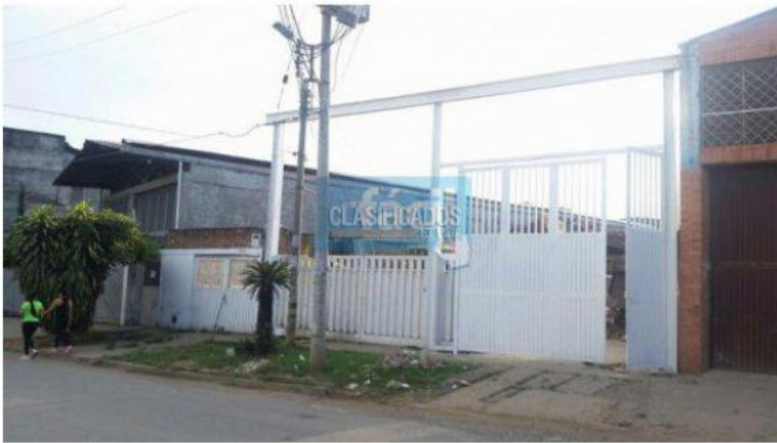
Lotes , Venta , La Base