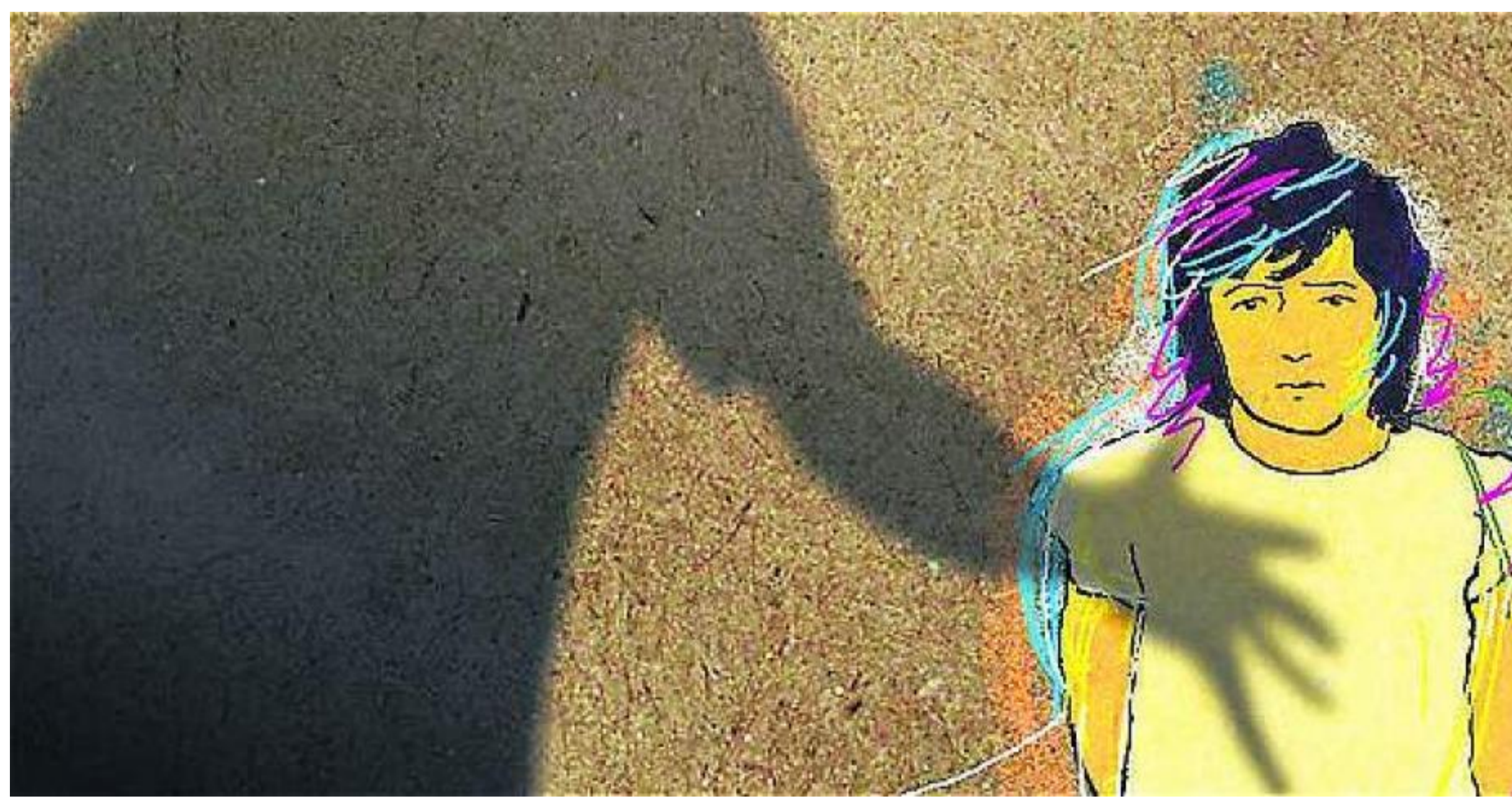
Dos menores fueron abusadas en Santander.

RELACIONADOS: VIOLACIÓN A MENORES | PORNOGRAFÍA INFANTIL | ABUSO CONTRA MENORES