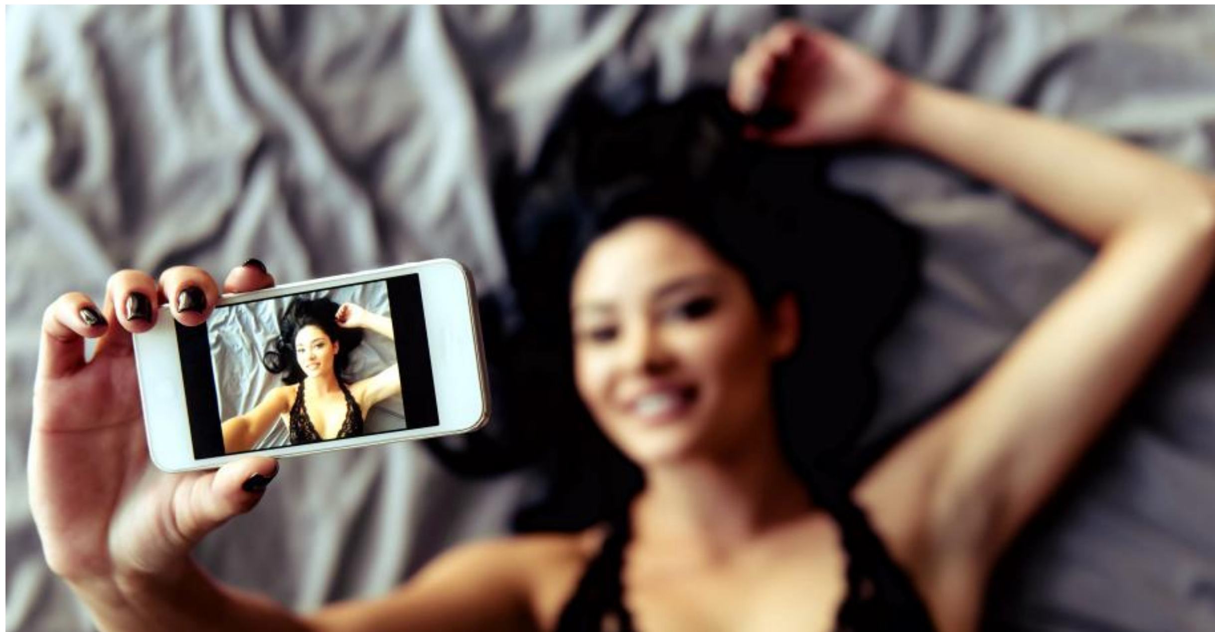
El 'sexting' en sí no representa un delito. Es el ejercicio de enviarse, de manera voluntaria, imágenes y videos íntimos.