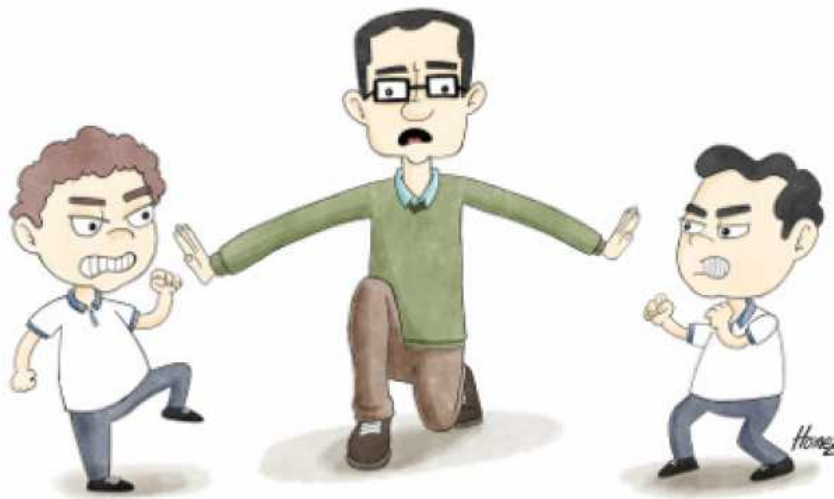
Ilustración | LA PATRIA | La resolución de conflictos y el bullying, una tarea conjunta para padres e instituciones educativas.