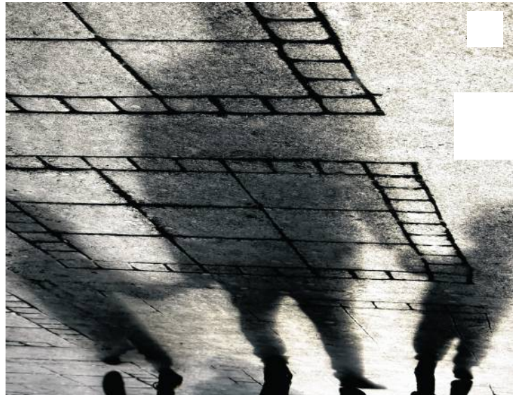
Según los psicólogos los adolescentes pueden tener muchas razones para huir de su hogar, por ejemplo, sentir el rechazo en sus entornos.

Viviana Quintero, coordinadora de Infancia de la Red PaPaz, explica que