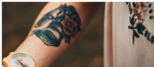
Los relojes de madera de la marca española llegan a Colombia con una sorpresa para el Día del Padre.