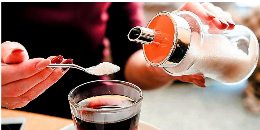
Tenga mucho cuidado con el villano de los mil alias.