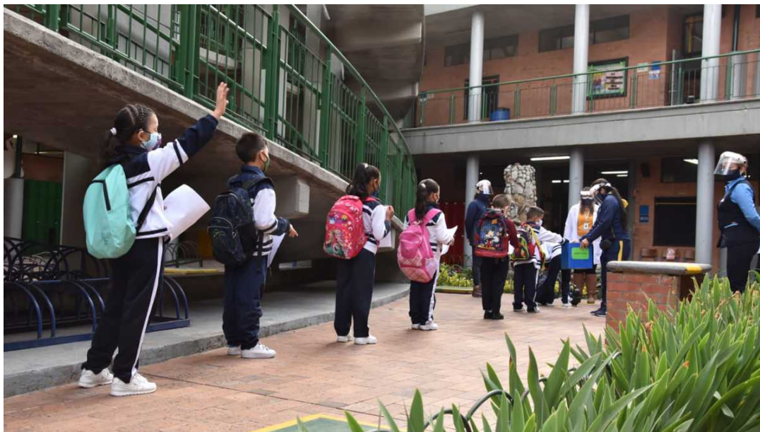
Regreso a clases con alternancia colegio distrital Bellavista

pueden acceder de manera fácil a internet, especialmente aquellos que viven en zonas rurales donde la llegada de la señal es más complicado.