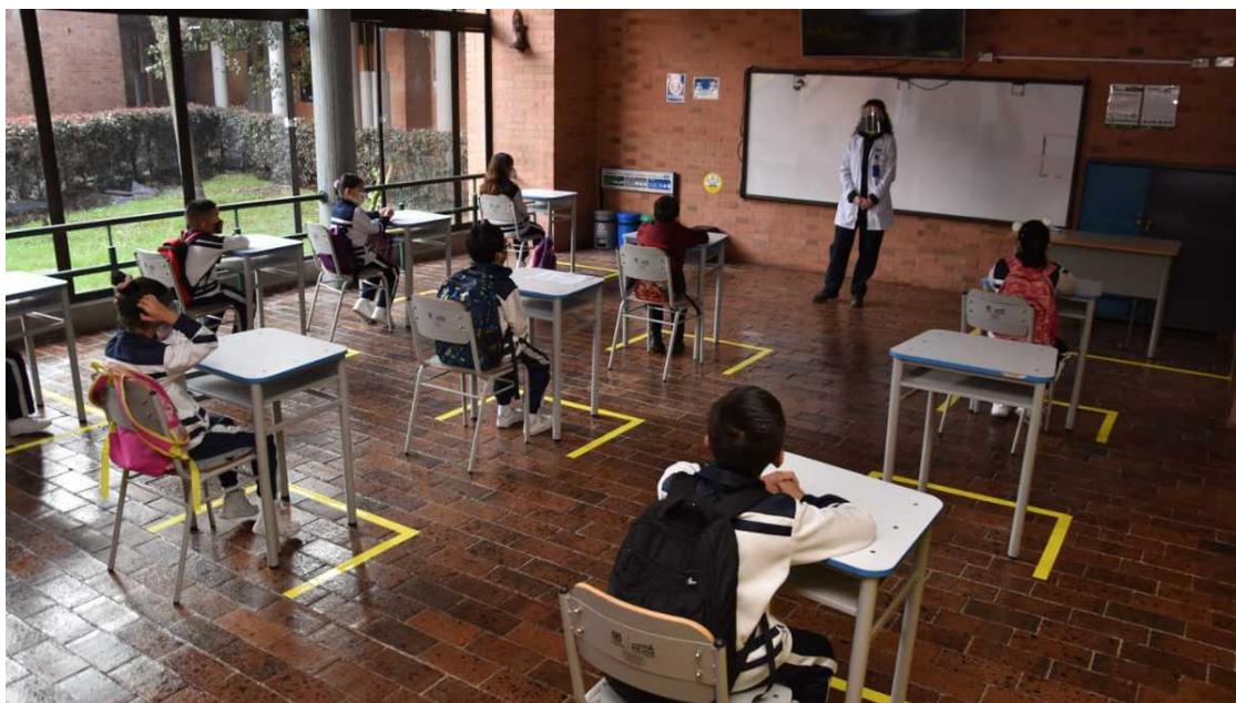
Regreso a clases con alternancia colegio distrital Bellavista

En un comunicado publicado en su página web, RedPaPaz informó que instauró una tutela contra el gobierno en cabeza del Ministerio de Educación, el ICBF, la Gobernación de Cundinamarca y la Secretaría de Educación de Bogotá para que los niños regresen a clases presenciales de inmediato.