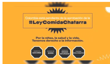
Aprueban proyecto de ley Comida Chatarra en el Senado junio 17, 2021 En «NACIONALES»