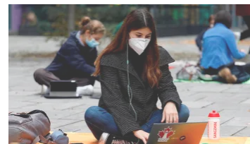
Se hundió proyecto que pretendía prorrogar la matrícula cero para universidades públicas junio 16, 2021 En «POLÍTICA»