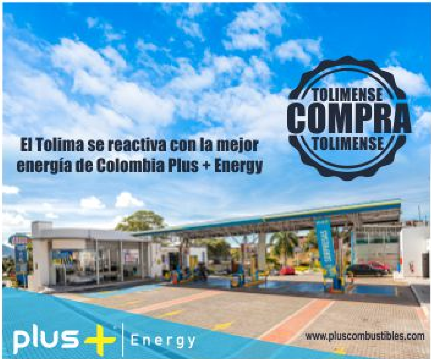
( https://bit.ly/plusEcos )