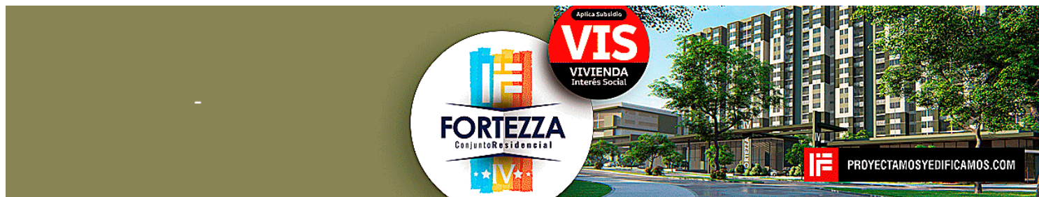
( https://bit.ly/pyeEcos )